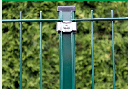
Pfostentyp WS- VA