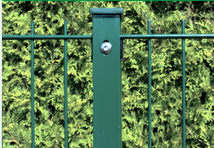
Pfostentyp WS- FA