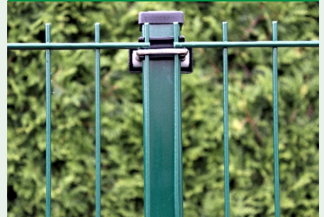
Pfostentyp WS- U- VA