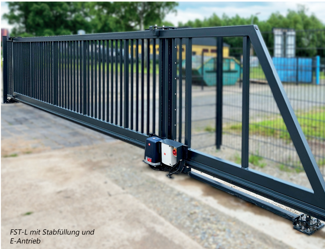
FST-L mit Stabfüllung und E-Antrieb