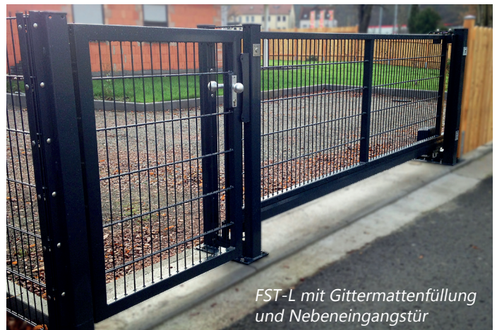
FST-L mit Gittermattenfüllung und Nebeneingangstür