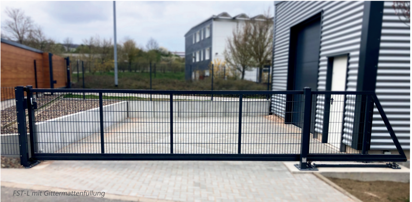
FST-L mit Gittermattenfüllung